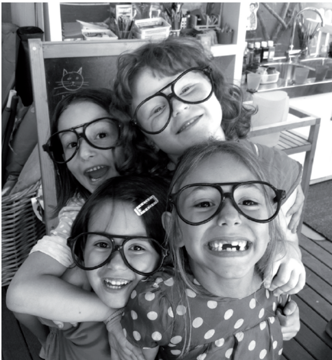
Alumnes a la classe d'Art i Tecnologia al casal d'estiu Dadà2011

VOLEM REVELAR, DISPARAR UNA CÀMARA ESTENOPÈICA, ESCULPIR EL NOSTRE AUTORETRAT, MIRAR-NOS LES NOSTRES MANS I FER-LES CRÉXER. VOLEM MAQUILLAR-NOS, APRENDRE A FER UN GUIÓ O A DESAPARÈXER EN EL MÓN MÀGIC DE MÈLIÈS!