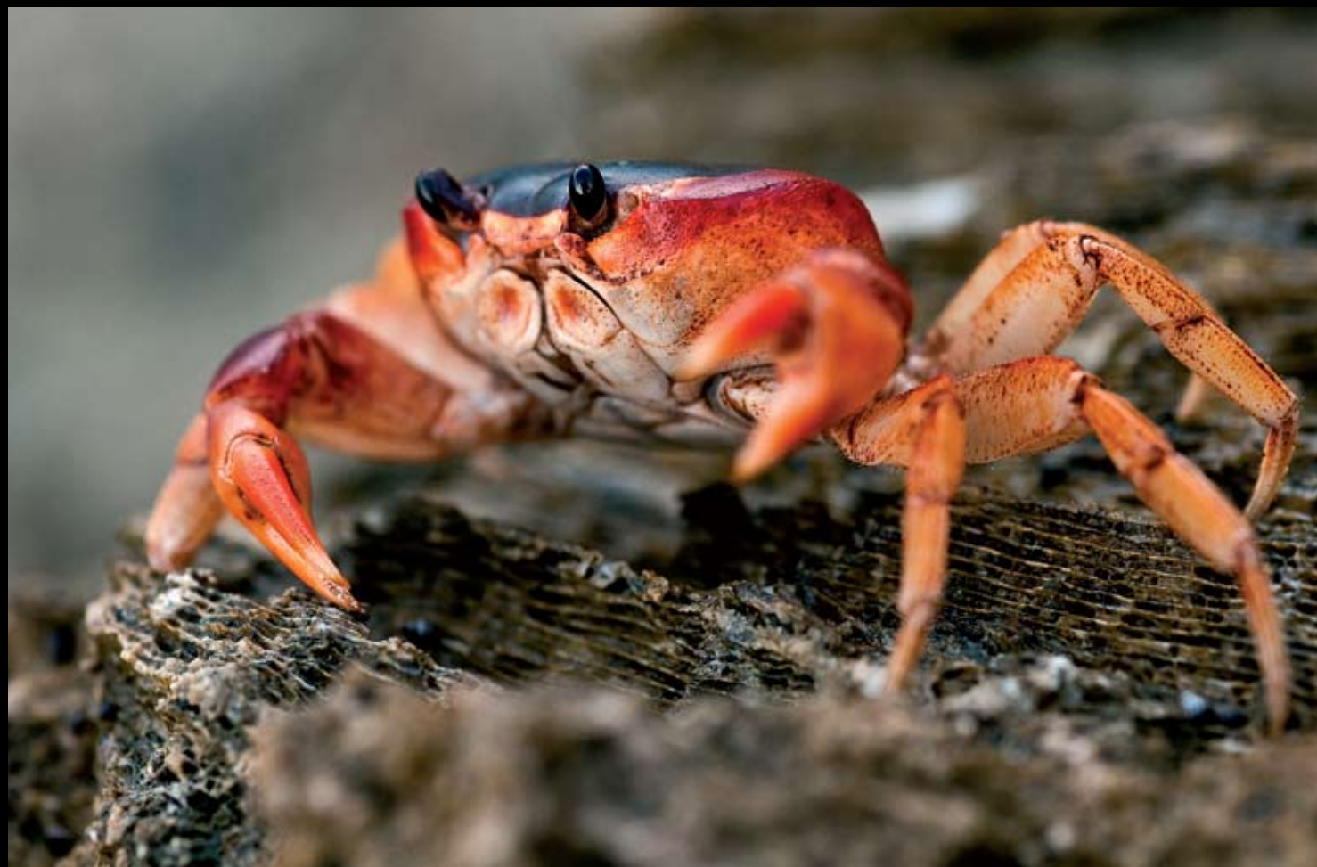
> Gecarcinus ruricola je velmi hojný zemní krab Kuby. Na snímku samička nese vajíčka, aby je nakladla do moře.