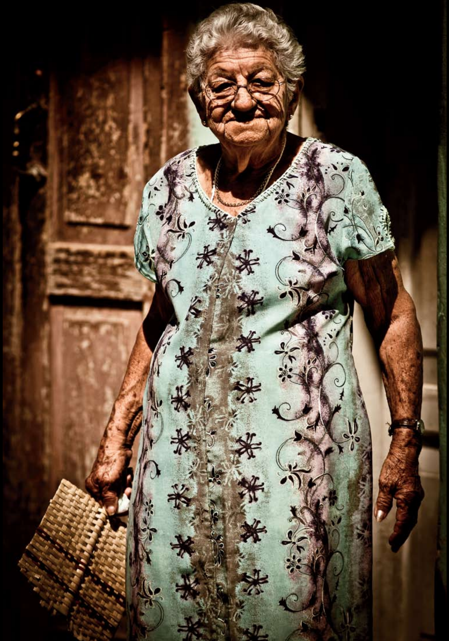
> Babička v centru Trinidadu - čekal jsem možná půl hodiny, než vystoupila ze stínu na světlo.