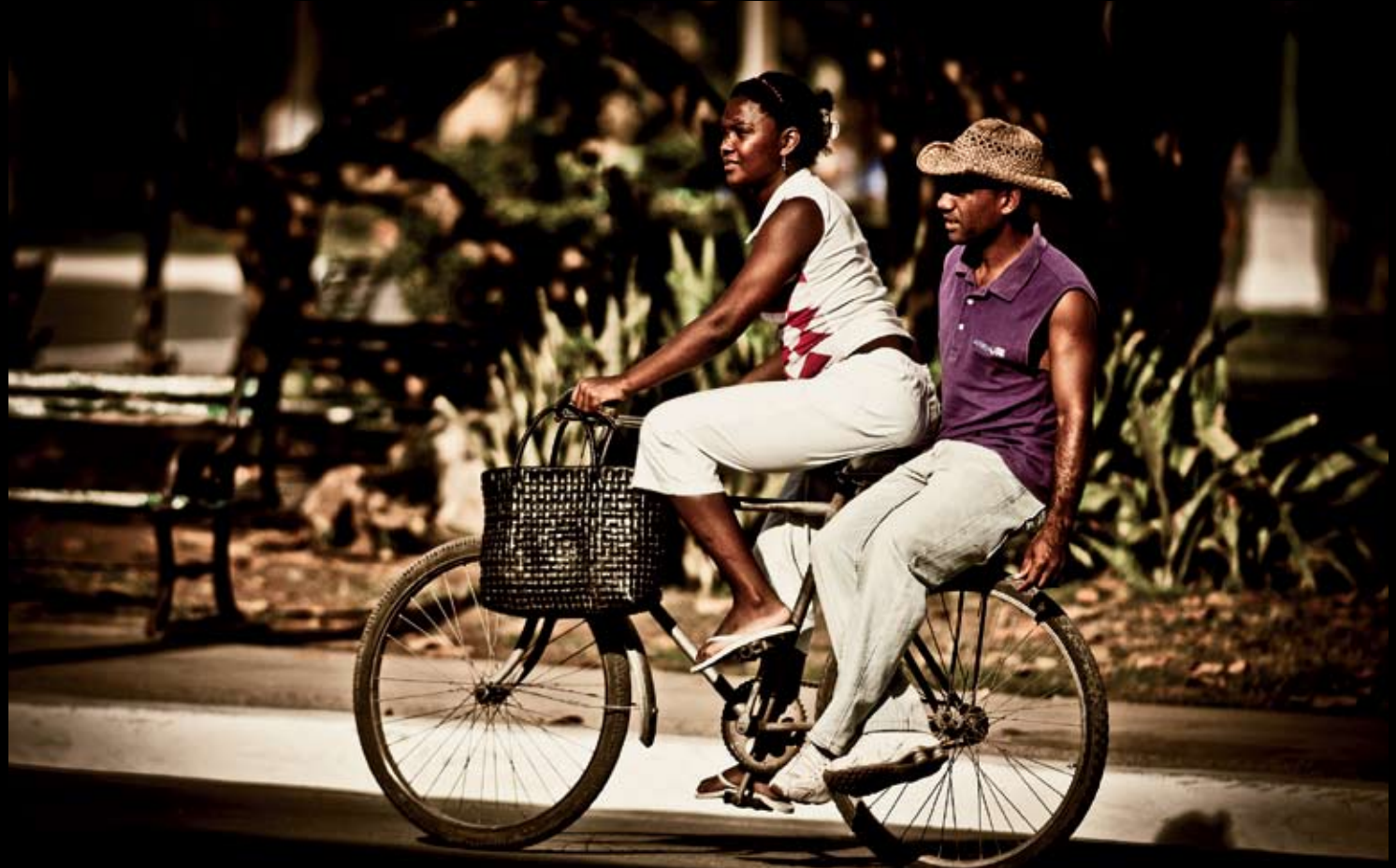
> Dobře to mají někteří zařízené. Morón.