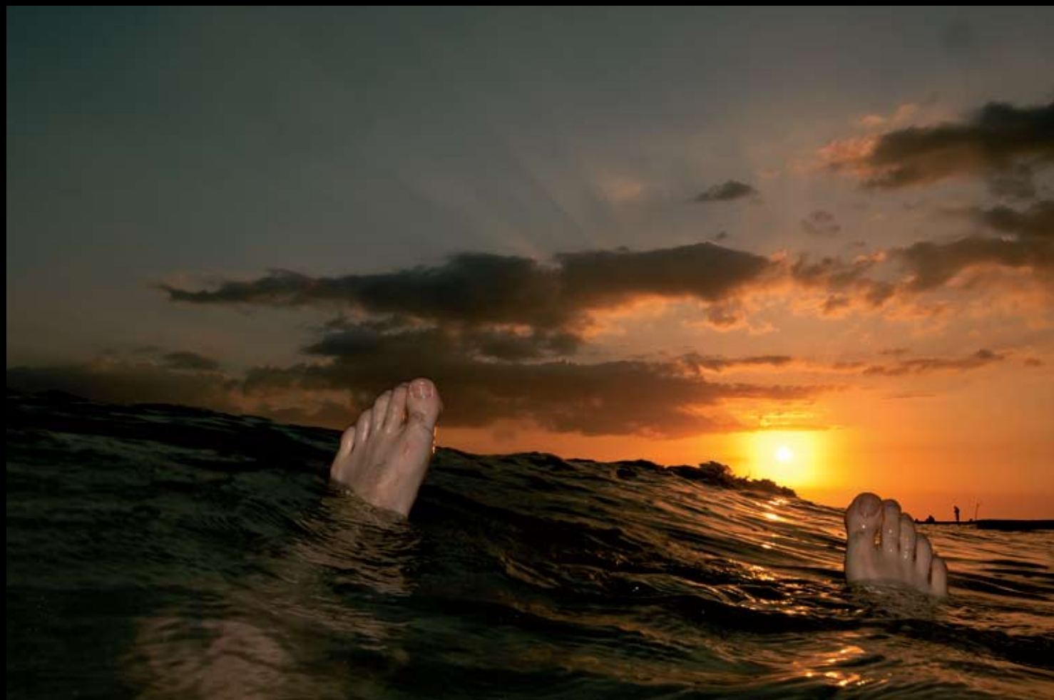
> Pomíjivá karibská pohoda - toho večera nás v noci pod širákem okradli.