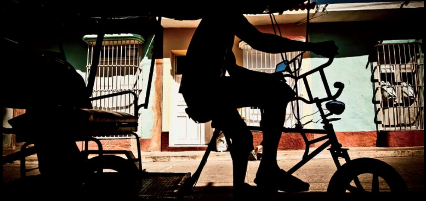
> Bicítaxi - tak Kubánci říkájí fenoménu, který mnoha z nich zajišťuje obživu. Trinidad.