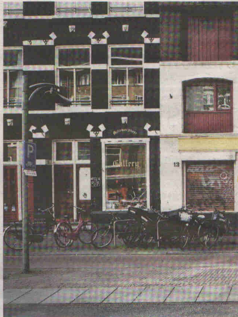
Overtoom 13-17: nu nog een leegstaande, voormalige houthandel, straks een hotel.

In 2004 waren de plannen getekend. De gevel zou overeind blijven, maar daarachter zouden de oude houtloodsen en kantoren plaatsmaken voor nieuwbouw. "We waren he-