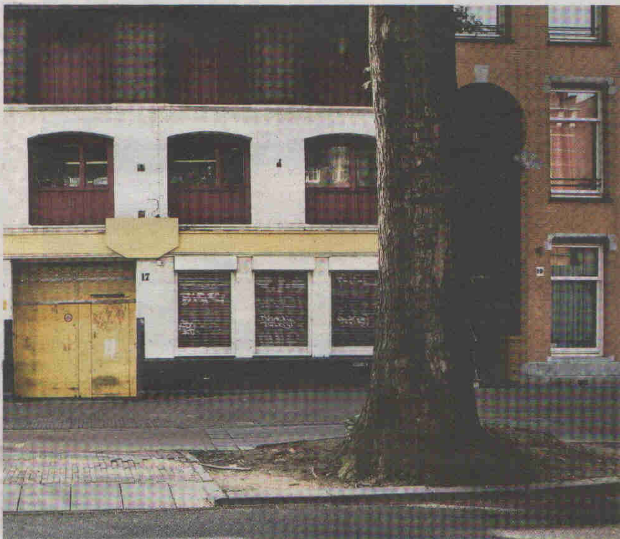
Architect Minke Wagenaar: 'Het verbaasde me ook dat we toch ruim tachtig kamers konden creëren.'

zo veel mogelijk bezwaar te maken. "Ekelschot is van plan een behoorlijk groot hotel bij mensen in de achtertuin neer te zetten," zegt de woordvoerder van Kop Overtoom. "In een kwetsbaar monument bovendien. Alle plannen gaan uit van zo veel mogelijk vierkante meters en een enorme kelder. Er zitten straks elke nacht honderdvijftig, tweehonderd mensen in onze binnentuin. In deze buurt zijn al tientallen hotels gevestigd. Aan de Overtoom zijn er onlangs ook twee bijgekomen. Het wordt een behoorlijke monocultuur."